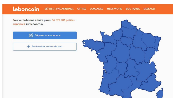
Un exemple de « marketplace » : Leboncoin

En règle générale, s'il n'est pas possible de vérifier tous les éléments relatifs au site sur lequel vous êtes, évitez de procéder à l'achat.